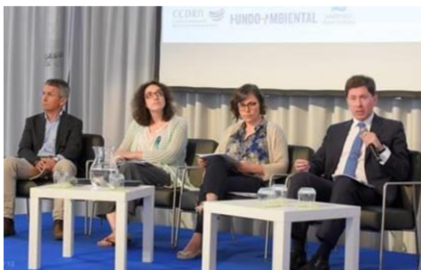
Figura 4 - Debate: Cidades e Territórios Circulares na Região do Norte (Bragança, Famalicão, Maia e Porto) - Conferência “Cidades e Territórios: Oportunidades e Benefícios da Economia Circular” Debate (Bragança, Famalicão, Maia e Porto)