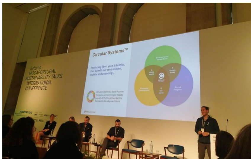
Figura 13 - Conferência Internacional 'FUTURES MODAPORTUGAL Sustainability Talks', organizado pelo CENIT