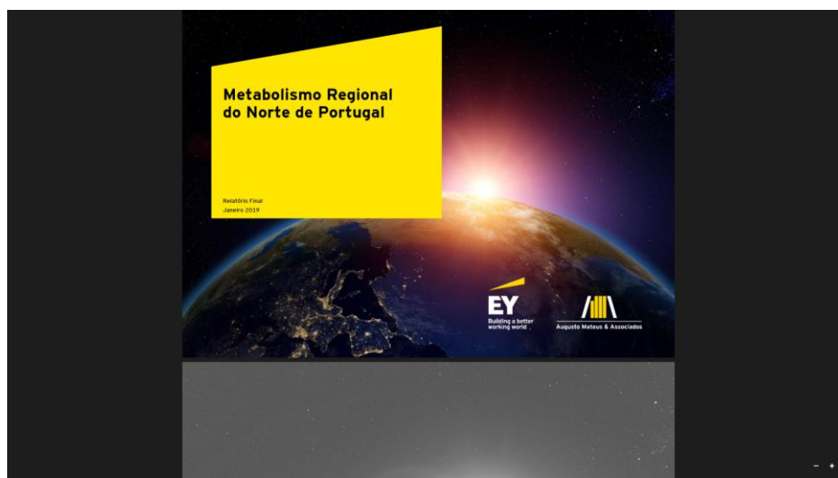
Figura 7 – documento técnico “Metabolismo Regional”