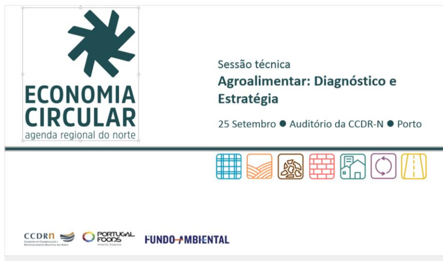
Figura 17 – Sessão Técnica Agroalimentar