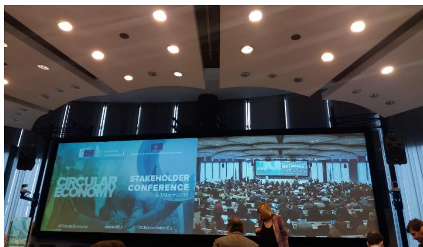
Figura 9 - '2019 Circular Economy Stakeholder Conference: Success Stories and New Challenges' - Bruxelas