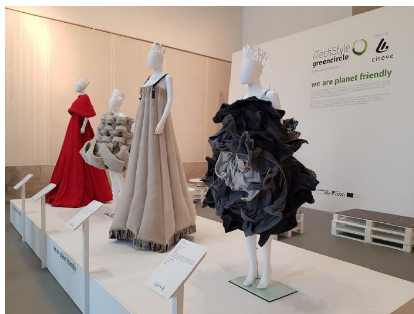
Figura 10 - Iniciativa iTechStyle Green Circle, integrada na Feira 'MODtissimo 54'