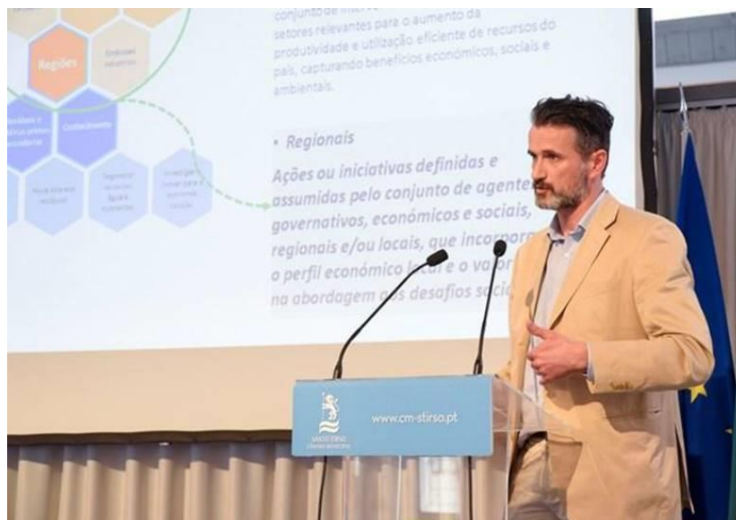
Figura 3 - Conferência “Cidades e Territórios: Oportunidades e Benefícios da Economia Circular”