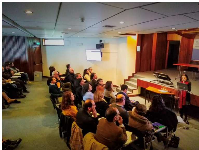
Figura 15 – Seminário Economia Circular e o Setor Alimentar, organização ARNEC / ECOFORUM