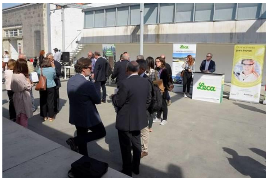
Figura 6 - Stands Promocionais de Empresas de boas Práticas Circulares