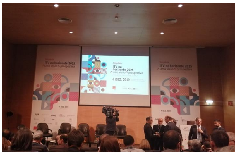
Figura 12 - 21º Fórum da Indústria Têxtil, organizado pela ATP