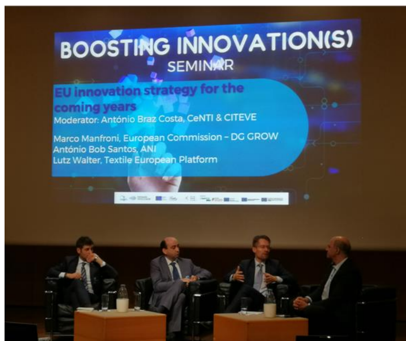
Figura 11 - Seminário 'Boosting Innovation(s)', organizado pelo CeNTI e o Cluster Têxtil