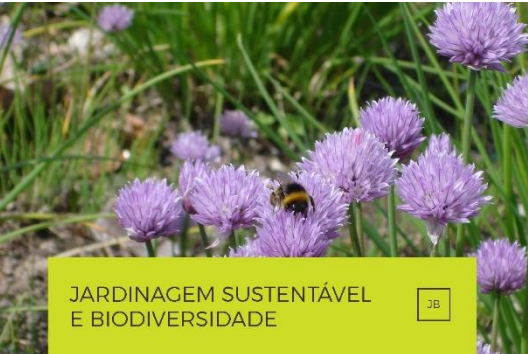
JARDINAGEM SUSTENTÁVEL E BIODIVERSIDADE